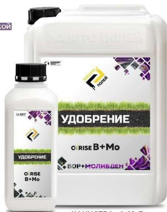
КАНИСТРА - 1, 10 Л

* СОСТАВ МОЖЕТ ОТЛИЧАТЬСЯ ОТ ЗАЯВЛЕННЫХ ЗНАЧЕНИЙ, ЧТО СВОЙСТВЕННО ПРОДУКТАМ ИЗ НАТУРАЛЬНОГО СЫРЬЯ (НЕ БОЛЕЕ ±5%).